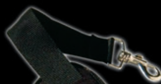
Tragegurt für Gitarrenkoffer