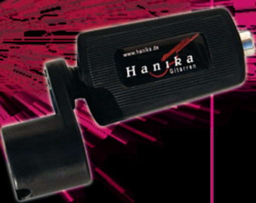
Saitenkurbel mit Stimmpfeife