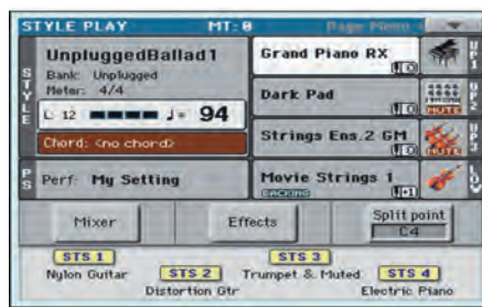
▲ Style Play Fenster im Easy Mode

Bei aller Technikpower ist der Pa300 leicht verständlich und einfach bedienbar geblieben. Denn Ihre Erfahrungen mit dem Pa300 sollen intuitiv, musikalisch, fließend und mühelos sein. Das Layout des Bedienfelds wur-